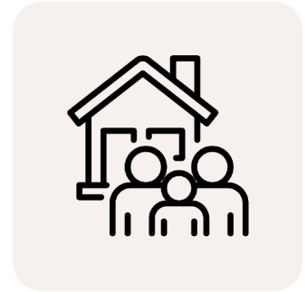
Samenwerking & gemak